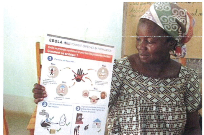
Ebola Vorbeugeseminar im Centre in Kaya

Unser Kontakt ist nicht unterbrochen. Alle Maßnahmen laufen weiter, wie bisher. Bitte halten Sie uns und den Afrikanern weiter Ihre Treue.