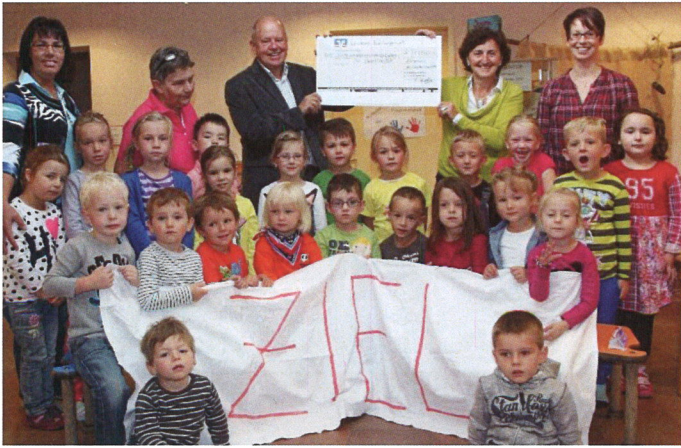
Spendscheck des Kindergartens Ennetach